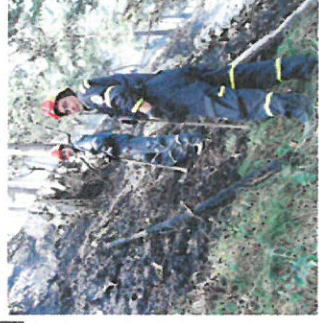
podieľa sa na likvidácii ohnisk

Fyzická osoba je povinná: dodržiavať vyznačené zákazy a plniť príkazy a pokyny týkajúce sa ochrany pred požiarom, dodržiavať zásady protipožiarnej bezpečnosti pri činnostiach spojených so zvýšeným nebezpečenstvom vzniku požiaru alebo v čase zvýšeného nebezpečenstva vzniku požiaru, oznámiť bez zbytočného odkladu príslušnému okresnému riaditeľstvu hasičského a záchranného zboru požiar, ktorý vznikol v objektoch, priestoroch alebo na veciach v jej vlastníctve, zabezpečovať pravidelné čistenie a kontrolu komínov, dodržiavať pri manipulácii s horľavými látkami a horenie podporujúcimi látkami požiadavky na protipožiarnu bezpečnosť, umožniť orgánom štátneho požiarneho dozoru vykonávanie potrebných úkonov pri zisťovaní príčin vzniku požiarov, zabezpečovať plnenie opatrení v súvislosti s ochranou lesov pred požiarom.