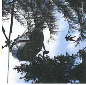
vykonáva záchranu osôb ohrozených požiarom