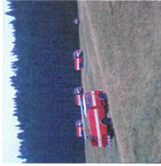
zabezpečuje dostatok hasiacej látky